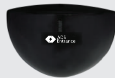
ATOMIC MICROWAVE SENSOR