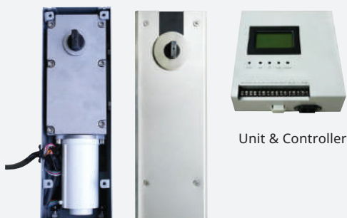
Unit & Controller