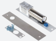
Electric lock* A06-000023